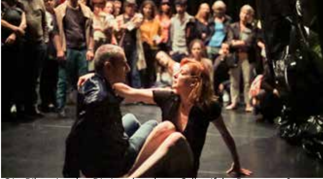
©La Ribot, Another Distinguée, photo: Collectif des Routes 2016

Vingt-trois ans se sont écoulés depuis que La Ribot initia le projet des Pièces distinguées qui depuis n'a cessé de se déployer et de se transformer, révélant à chaque fois de nouvelles couches et significations. Courtes actions organisées en séries, chaque série est un spectacle, les Pièces distinguées ont été présentées dans différents dispositifs qui vont de la scène du théâtre à la galerie d'art. Another Distinguée, la nouvelle série qui est présentée en 2016, ajoute à l'œuvre des Pièces distinguées une nouvelle strate en l'amenant dans un lieu surprenant où tout ce qui a été fait auparavant se redéfinit.