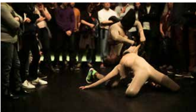
©La Ribot, Another Distinguée, photo: Collectif des Routes 2016

Another Distinguée ne nous montre pas que de la nouveauté mais nous précipite vers l'inconnu. La clarté caractéristique des pièces antérieures s'est transformée en un espace d'ombres, en une obscurité graphique presque onirique dans laquelle le corps de La Ribot a cessé d'être un fétiche pour le regard du spectateur et est devenu une sorte de présence multipliée qui glisse et habite d'autres corps possibles. Héroïne et super héros, guerriers, sirènes, La Ribot et ses acolytes s'inventent et se dessinent à chaque pièce une identité... pour mieux l'oublier par la suite.